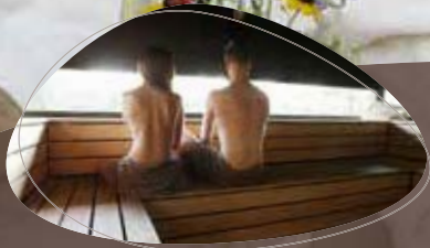
8 heerlijke sauna's